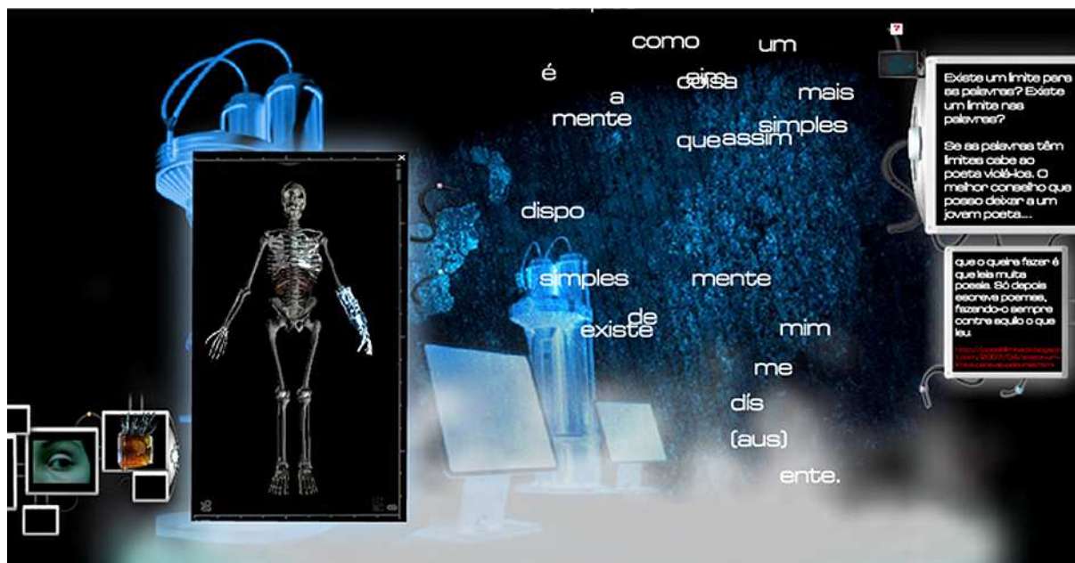
Figura 2: A Interface do Ambiente Criogenia apresenta hipertextos com possibilidades de interação e navegação.

A conectividade estabelece vínculos e relações entre diferentes aspectos presentes na Internet. É estabelecida a partir dos links , tanto os internos quanto os externos, sendo que a externalidade está relacionada aos vínculos e ligações além do limite físico da mídia, neste caso, um cd-rom que tem em sua programação a possibilidade de acesso a vários web-sites e blogs que se relacionam com a temática de morte e vida em suspensão (figura 2). Bonsiepe (1993 e 1997) indica que a conectividade é a chave do futuro da informática estabelecendo novas formas de trabalho e novas formas de projetar.