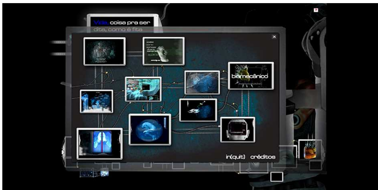
Figura 4: Interface do mapa de navegação que apresenta o link para dúvidas possibilitando maior conforto ao usuário.

O menu tem como proposta tornar as informações acessíveis de forma mais rápida ou mais objetiva. Ainda, o interator pode navegar através do mapa de navegação disposto e, podendo ser acionado em qualquer uma das interfaces ou ambientes (figura 4).