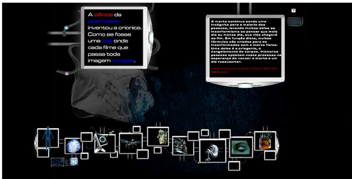
Figura 3: A Interface de navegação apresenta as possibilidades de acesso pelo menu e também pelos links hipertextuais.

O menu tem como proposta tornar as informações acessíveis de forma mais rápida ou mais objetiva. Ainda, o interator pode navegar através do mapa de navegação disposto e, podendo ser acionado em qualquer uma das interfaces ou ambientes (figura 4).