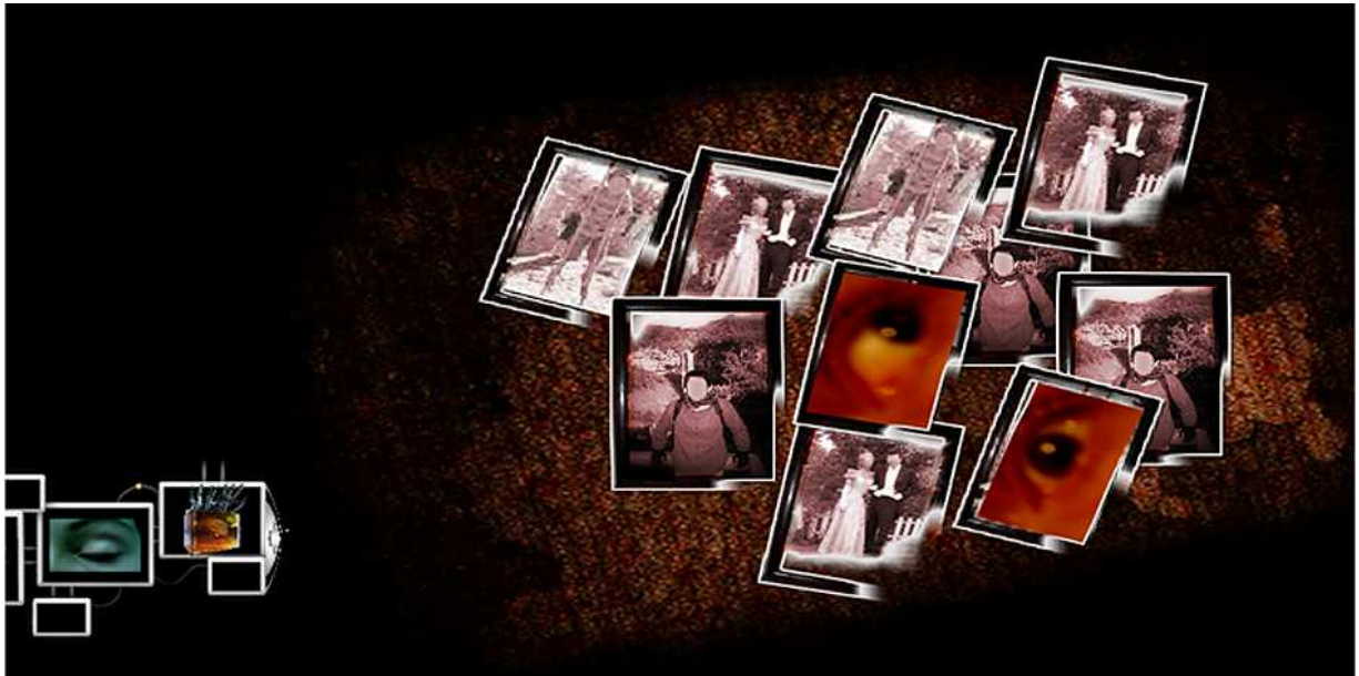
Figura 5: A Interface do Ambiente Coma apresenta imagens estáticas e em movimento – fotografias, vídeos e animações.

experiência maior que ocorre nos ambientes. Desta forma, os ambientes estão organizados com as seguintes temáticas: criogenia; coma; transformação; biomecânico; clonagem; tecnologia (figura 5).