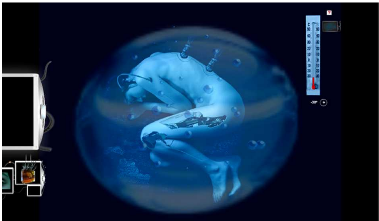
Figura 6: Interface do Ambiente Criogenia com a possibilidade de interação no objeto termômetro.

A interação ocorre a partir da utilização de hipertextos com links, botões e cores dispostos em áreas sensíveis das interfaces, ou seja, programadas para uma ou mais possibilidades de interação. Além disto, o interator pode provocar mudanças no ambiente, ora tornando-o mais frio ou mais quente, por exemplo, conforme a ação do interator com relação ao objeto termômetro disposto na interface da criogenia.