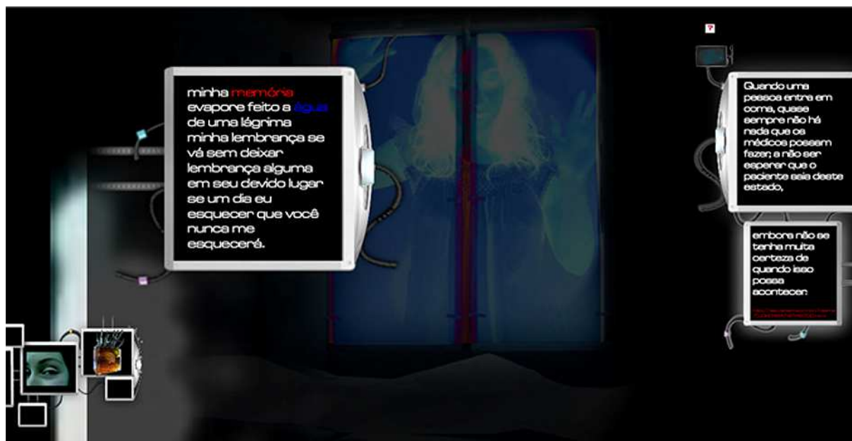
Figura 7: A Interface do Ambiente Coma apresenta possibilidades de navegação e conectividade.

As possibilidades de interação e envolvimento com a proposta levam às interpretações e fruições diversas a partir das relações não-lineares e hipertextuais. Por sua vez, a interação intuitiva e exploratória permite o inter-relacionamento dos significados e contextos abordados que ocorrem pela ação do interator. São realidades múltiplas, concebidas em tempo e espaço distintos. A imagem em conjunto e inter-relacionada com o som, o movimento, a ação da navegação geram e estimulam a interação e a reflexão (figura 6).