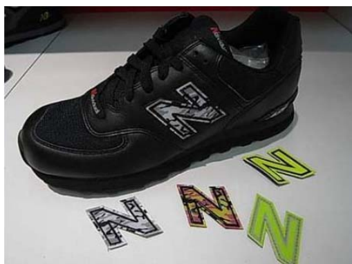
Figura 3- Nindividual

Outro exemplo é o Nindividual, da New Balance, onde o logotipo situado na região lateral do cabedal pode ser retirado e trocado pelo de outra cor. O material do logotipo é tecido e velcro, o que possibilita uma maior flexibilidade na hora da troca.