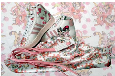
Figura 1- Adidas Adicolor Fafi

Ex: customizações feitas pelos artistas gráficos Fafi e Sabotage.