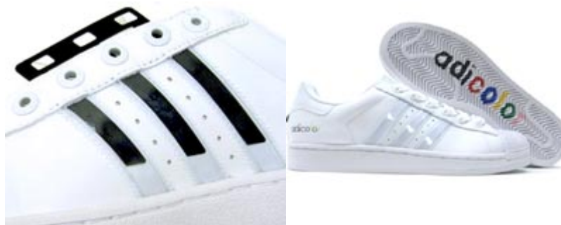
Figura 2- Adicolor W5- customização através de peça retirável.

Outro exemplo é o Nindividual, da New Balance, onde o logotipo situado na região lateral do cabedal pode ser retirado e trocado pelo de outra cor. O material do logotipo é tecido e velcro, o que possibilita uma maior flexibilidade na hora da troca.