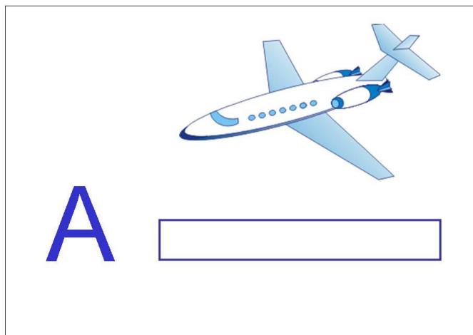
Figura 1: Associação de Imagem à Vogal A

Durante os atendimentos das crianças do projeto de pesquisa, observamos que crianças cadeirantes interagem menos com ambientes externos. Quando apresentada a imagem de uma abelha, inseto de áreas externas, foi observado que as crianças relacionaram a imagem com uma mosca, inseto encontrado mais facilmente em áreas internas. É mais fácil memorizar o avião, imagem vista freqüentemente em programas de TV. A figura 1 abaixo exemplifica a associação da imagem do avião com a vogal A.