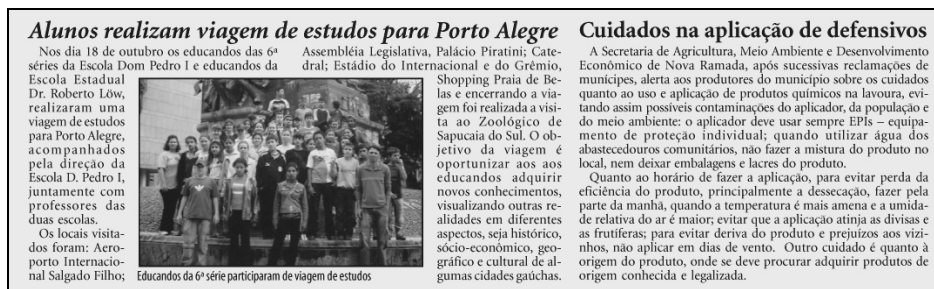
Figura 2: Exemplo de títulos lado a lado no jornal Gazeta Regional.

Para os textos do Gazeta Regional foi escolhida a fonte Minion, classificada segundo a Vox/Association Typographique Internationale (apud NIEMEYER, 2003), como uma romana garalda de aspecto sóbrio com hastes finas, o que deixa a página mais arejada. São usados onze pontos no corpo, indicado segundo estudos de legibilidade por Rob Carter (1997 apud GRUSZYNSKI, 2000, p. 59). O espaço entrelinha adotado é suficiente para que se diferencie daquele utilizado entre as palavras que, conforme Willberg e Forssman (2003, p. 30), deve ser claramente maior. Para a diagramação foram definidos os principais “estilos” tipográficos conforme os exemplos a seguir: