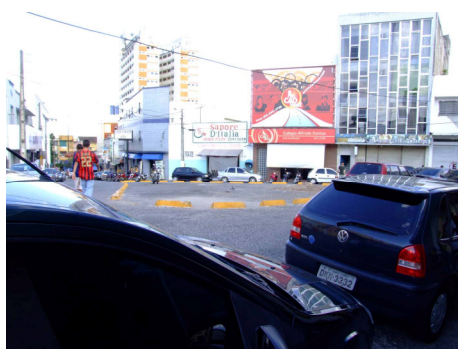
FIGURA 03: Vista do lado oeste às 8h da manhã.

Encontra-se a seguir a aplicação do estudo da temporalidade do espaço urbano realizado num curto período em três horários, manhã, tarde e noite.