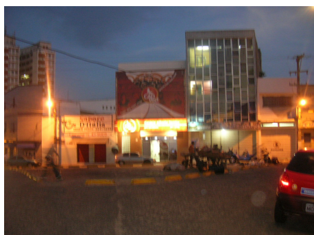
FIGURA 04: Vista do lado oeste às 17h da tarde.