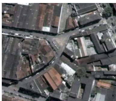
FIGURA 02: Vista área da área das Buninas.

Encontra-se a seguir algumas considerações a respeito das diferentes configurações do espaço estudado obtidas a partir da análise visual nos períodos curtos e longos. Os dados foram levantados por meio de pesquisa de campo e com habitantes e historiadores da cidade, além de observação sistemática e registro fotográfico.