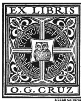
Figura 3: Ex libris de Oswaldo Cruz. Fonte: ESTEVES, 1956, p.153.

Além do valor artístico incontestável, alguns ex libris apresentam especial valor histórico por terem pertencido a importantes cidadãos e instituições do país. Um desses é o de Oswaldo Cruz, médico que combateu a Febre Amarela no país em 1903. O ex libris (Fig. 03) é um retrato da importante trajetória dele: apresenta no centro a figura de uma coruja, símbolo da ciência, envolta pela frase “Fé Eterna Na Ciência”; dentro de uma ornamentação sobressai a Cruz de Cristo; e, no topo, está a expressão “Ex libris” acompanhada, na base, pelo nome “O. G. Cruz”.