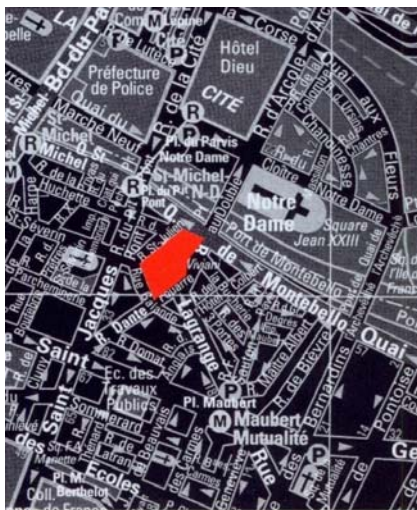
Img. 2 “lugares que realmente não possuem qualquer razão de existir”

Artistas como Asger Jorn, Ivan Chtcheglov, Guy Debord, Gil J. Wolman, integrantes fundadores de A Internacional Letrista, nos anos de 1950 produziram mapas que eram registro de experimentações que eles promoviam do espaço urbano. Porém suas produções fogem às configurações dos mapas convencionais: As metagrafias influenciadas , de Gil J. Wolman são colagens de imagens e de frases recortadas de jornais.