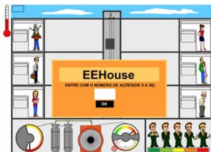
Figura 3 – escolha do número de operações e conseqüentemente do nível.

Na parte superior estão os condôminos, que são entidades controladas pelo computador, que vão apresentando suas necessidades com o desenrolar do jogo. Suas necessidades podem variar em ação de tomar banho, ação de passar roupa, ação de assistir televisão, ação de escutar rádio, ação de lavar roupa, dentre outras e cabe ao usuário aceitar ou rejeitar as ações.