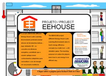
Figura 1 – primeira interface do jogo eletrônico informatizado educacional EE House .

Do lado esquerdo inferior estão os maquinários do prédio, onde o usuário pode acompanhar os gastos de energia divididos em dois quesitos, consumo de energia elétrica é consumo de gás.