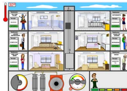
Figura 4 –interface completa.

As metas a atingir no EEHouse é um equilíbrio entre o baixo consumo energético e a satisfação de todos os condôminos, isto é, o usuário deve aprender a economizar energia e priorizar para o consumo ações que realmente são indispensáveis. Dessa forma, o usuário chega ao fim do jogo vitorioso.