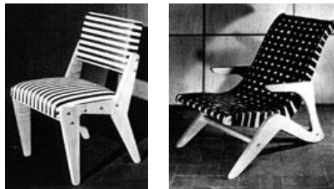
Figura 4 – Cadeira e espreguiçadeira em compensado recortado.

No final dos anos 60, Zanine estabeleceu-se no Rio de Janeiro, onde construiu dezenas de casas no bairro Joatinga, realizando ali uma arquitetura ao mesmo tempo colonial e moderna (figura 5). Na produção arquitetônica, a concepção é simples, aliando a composição volumétrica e o equilíbrio entre a madeira e o material de demolição, integrando-os com o meio ambiente. Neste período, unindo sua habilidade em trabalhar a madeira com a experiência de maquetista, Zanine Caldas conquista fama de arquiteto, “com suas casas de madeira rústica, construídas de modo bastante artesanal: montava no chão um gabarito, no tamanho real da casa a ser construída e, de acordo com este, serrava as madeiras, fazia os encaixes e erguia a estrutura” (MARTINS, 2005, p.19).