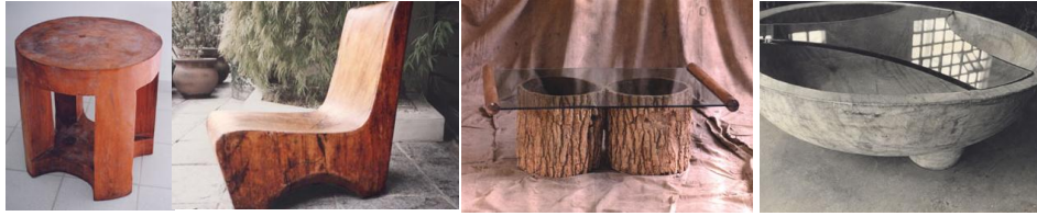
Figura 6 – Coleção de móveis desenvolvidos por Zanine Caldas – maturidade da obra

experiência anterior, ou seja, utiliza a densidade natural da madeira (figura 6), o que reflete a preocupação com a natureza, característica da sustentabilidade.