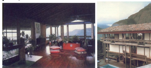
Figura 5 – Casa Pedro Valente, Joatinga, RJ. 1973 – interior e vista externa

No final dos anos 60, Zanine estabeleceu-se no Rio de Janeiro, onde construiu dezenas de casas no bairro Joatinga, realizando ali uma arquitetura ao mesmo tempo colonial e moderna (figura 5). Na produção arquitetônica, a concepção é simples, aliando a composição volumétrica e o equilíbrio entre a madeira e o material de demolição, integrando-os com o meio ambiente. Neste período, unindo sua habilidade em trabalhar a madeira com a experiência de maquetista, Zanine Caldas conquista fama de arquiteto, “com suas casas de madeira rústica, construídas de modo bastante artesanal: montava no chão um gabarito, no tamanho real da casa a ser construída e, de acordo com este, serrava as madeiras, fazia os encaixes e erguia a estrutura” (MARTINS, 2005, p.19).