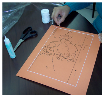
Confecção de matriz tátil.

Como resultado desta ajuda o deficiente tem em mãos uma matriz tátil, que pode ser o seu mapa tátil para ensino, pesquisa, lazer, divertimento e conhecimento geral. Caso o usuário queira reproduzir o mapa, a fim de disponibilizar para seus colegas, ele pode reproduzir o mapa, através da sua matriz tátil.