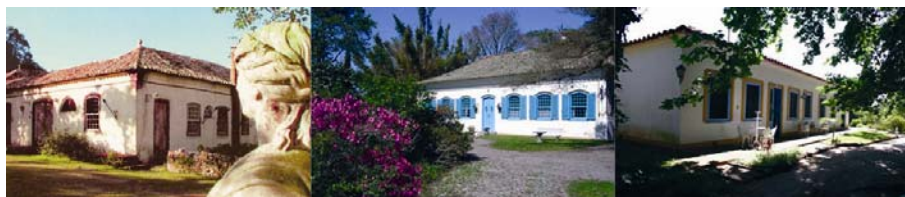
Fig. 2 – Cartões postais da Charqueada São João, Charqueada Santa Rita e Estância do Laranjal