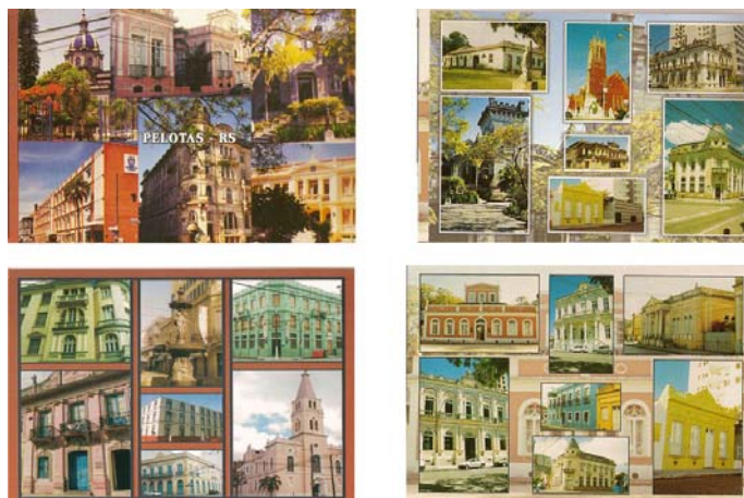
Fig. 5 – Cartões Postais

Já em exemplos mais recentes (figura 6), o fotógrafo abandona o plano geral e vai até o detalhe: em um dos postais, uma tarja centralizada sobre um fundo branco apresenta quatro pequenas fotos, que se complementam na apresentação do tema. Abaixo, a inscrição “Pelotas” é ladeada por dois motivos decorativos que remetem à arquitetura eclética. Ao lado, um postal apresenta oito diferentes imagens.