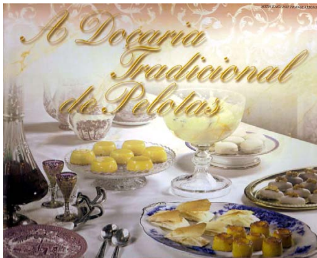
Fig. 7 – Capa do livro “A Doçaria Tradicional de Pelotas”

Nos cartões postais, o dourado dos quindins e ninhos mistura-se com o amarelo-ouro do fundo e, juntamente com a decoração dos doces, remete a uma atmosfera de fartura, luxo, sofisticação e nobreza, procurando resgatar a sofisticação de uma época em que a civilização do sal produziu as delícias do açúcar.