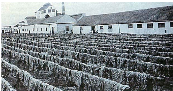
Fig. 1 - Charqueada Mazza.