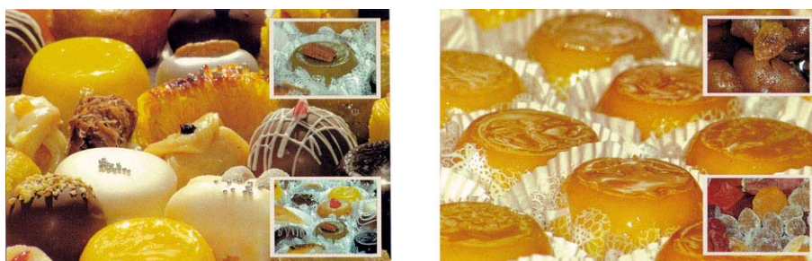
Fig. 8 – Cartões Postais

Nos cartões postais, o dourado dos quindins e ninhos mistura-se com o amarelo-ouro do fundo e, juntamente com a decoração dos doces, remete a uma atmosfera de fartura, luxo, sofisticação e nobreza, procurando resgatar a sofisticação de uma época em que a civilização do sal produziu as delícias do açúcar.