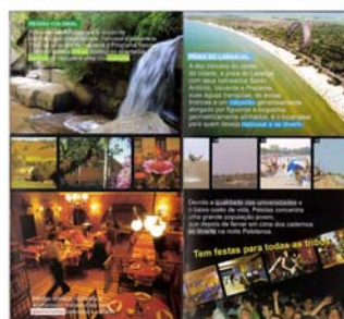
Figs. 10 e 11 – Capa do caderno “Pelotas 194 anos” do jornal Diário Popular e Folder da Secretaria Municipal de Turismo, Esporte e Lazer.