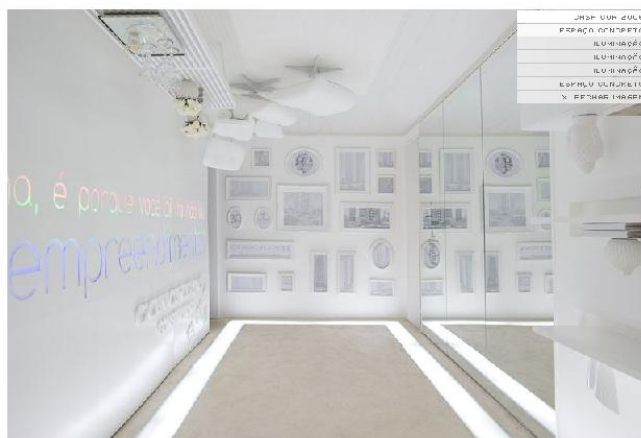
FIGURA 1 – “Espaço concreto”, Eduarda Corrêa . Casa Cor Minas Gerais 2006.