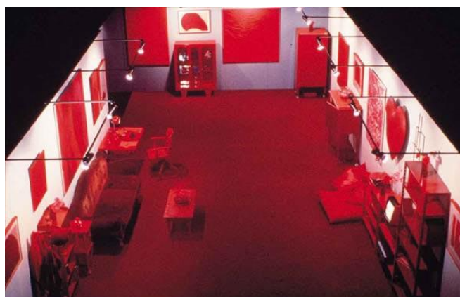
FIGURA 2 – “Desvio para o vermelho”, Cildo Meireles . 1968-84. Centro de Arte Contemporânea Inhotim Brumadinho. Minas Gerais – Brasil.

O “Espaço Concreto” marca um diálogo direto com obras de ícones da arte conceitual como a instalação “Desvio para o Vermelho” (1967-1984) de Cildo Meireles que estrutura um espaço composto por objetos de várias tonalidades de vermelho ou como a obra “Sala de Gravidade” do polonês Jaroslaw Kozlowski exposta na Bienal de São Paulo no mesmo ano de 2006 dispondo o mobiliário nas paredes e teto de forma inversa à convencional (Ver FIG. 2 e 3).