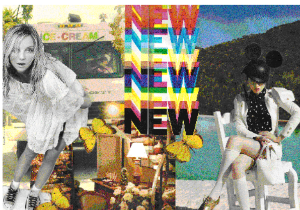
Figura 3: painel imagético criado a partir das micro-tendências apontadas pelos Setores de Referência para verão 2009/2010.

Como fonte comunicativa auxiliar ao texto, são elaborados um ou dois painéis imagéticos a fim de ilustrar conceitos e tendências captados, filtrados, analisados e interpretados (figura 3).