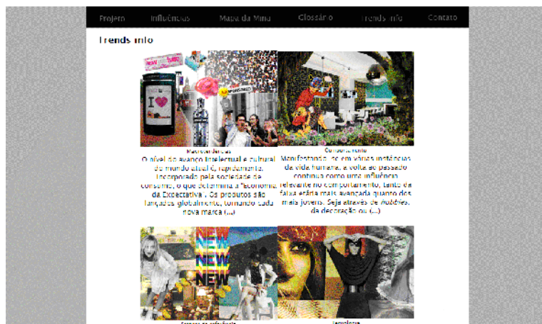
Figura 4: website do projeto de pesquisa que está na rede desde dezembro de 2007.