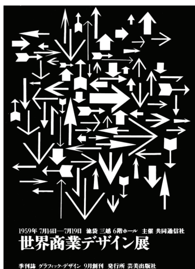
Fig. 1: World Graphic Design Fonte: Ikko Tanaka Showcase, 2002

Nestes dois cartazes (fig. 1 e 2) o traço principal é o uso da acromia, sem tons intermediários. O contraste gerado é facilmente percebido, de modo que as formas, em todos os cartazes, são bem definidas.