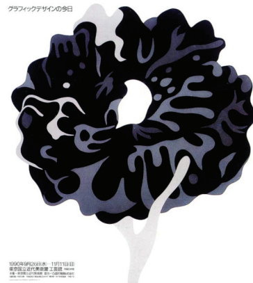
Fig.6: Graphic Design Today

Para o cartaz da exposição Graphic Design Today (fig.6) Ikko aplica cinco matizes no nome da exposição. Há uma relação de equilíbrio quanto ao contraste de luminosidade. Isso faz com que o olhar percorra o bloco de letras coloridas.