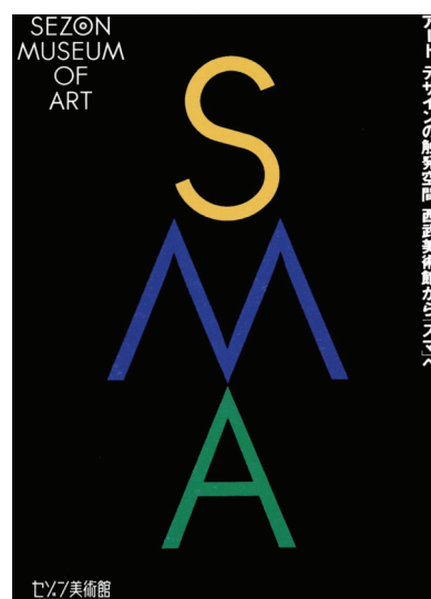
Fig.4: Sezon Museum of Art

No cartaz Ginza Saison Theatre (fig.3), Tanaka usou apenas cinco cores; próximas umas às outras, ele usou vermelho, amarelo e azul, cores que por si só já são contrastantes. O equilíbrio que há entre essas três cores se dá pela área que cada uma ocupa: o amarelo e o vermelho, mais luminosos ocupam áreas menores que o azul. O centro óptico do cartaz é marcado pela confluência destas cores, sendo que o contraste entre o azul e o amarelo é muito chamativo. No entanto, há uma harmonia entre estas três cores, de modo que nenhuma se sobressai sobre as demais.