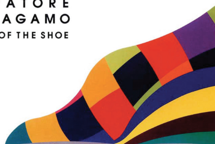
Fig.7: The Art of the Shoe, 1997 (tratado digitalmente para correções de tamanho e cores)