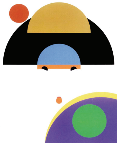
Fig.5: The New Spirit of Japanese Design: Print