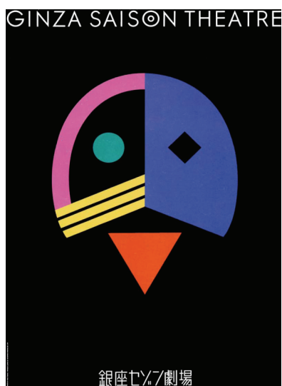
Fig.3: Ginza Saison Theatre