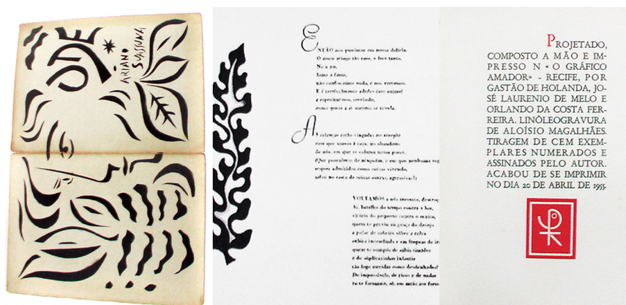
Figura 2: Capa de Ode , em linólio, de 1955. Página com xilo, de 1957, e colofão à direita.

O Gráfico Amador. Criado no Recife, por um grupo de intelectuais: “...pessoas interessadas na arte do livro. Fundado em 1954, tem a finalidade de editar, sob cuidadosa forma gráfica, textos literários cuja extensão não ultrapasse as limitações de uma oficina de amadores. Os trabalhos são projetados e realizados por Aloísio Magalhães, Gastão de Holanda, José Laurêncio de Melo e Orlando da Costa Ferreira”. Encerra suas atividades em 1961.