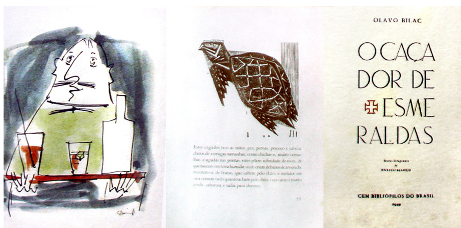
Figura 1: Exemplos de ilustrações e composição tipográfica em 3 edições distintas.

Sociedade dos Cem Bibliófilos. Fundada em 1943, cem sócios juntaram-se para a promoção de suas edições. Nasceu por empenho e dedicação de Raymundo de Castro Maya, no Rio de Janeiro. Publicou mais de 20 edições, sempre com textos cuidadosamente escolhidos e ilustrações de significativos artistas brasileiros. A partir da sétima publicação, conta com o planejamento gráfico e artístico de Darel, encerrando suas atividades em fins da década de 1960, com a morte de seu fundador.