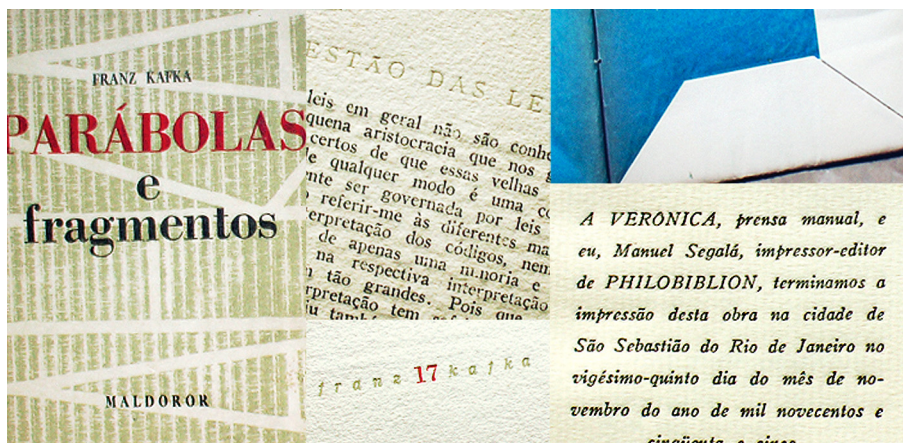
Figura 3: Capa de livro, composta em Didot, e detalhes de composição tipográfica e de acabamento.

visual de suas edições. As ilustrações, sobretudo xilogravuras de Segalá, são usadas de maneira inventiva, nos fôlios, capitulares, vinhetas, ou associadas ao texto, criando páginas fortes visualmente.