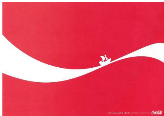
Figura 3: Descobrimento , 2003.