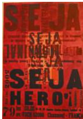
Figura 4: Brasil em Cartaz II , 2005.