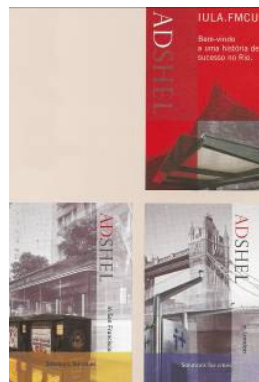
Figura 2: IULA e UITP , 2001.