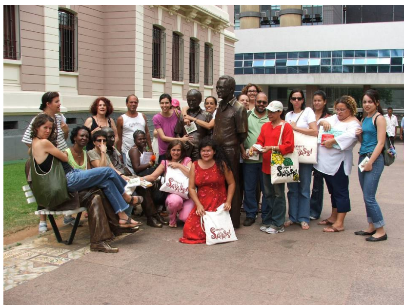
Figura 1: Primeira visita do grupo à Praça da Liberdade