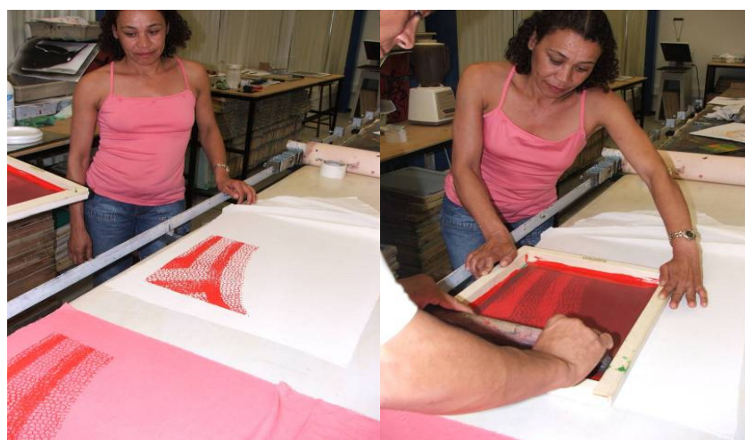
Figura 3: Oficina de Serigrafia