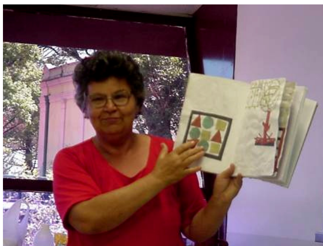
Figura 2: Artesã mostrando seu caderno de processos

processo, no início, acontecia por meio de orientações coletivas, onde cada artesão apresentava sua idéia, esboço ou protótipo para o grupo e as orientações das designers eram compartilhadas por todos, em espaço aberto para discussão das questões comuns dos artesãos participantes. À medida que os projetos foram se definindo e as dúvidas tornando-se cada vez mais particularizadas de acordo com as dificuldades específicas de cada produto, as orientações se individualizaram, mantendo a participação conjunta das designers em todas as intervenções e direcionamentos.