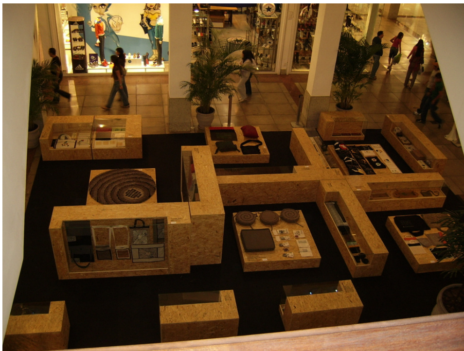
Figura 6: Exposição da coleção Sempre Savassi

Em todos os nossos projetos de extensão com caráter social há um envolvimento intenso dos alunos para que se possa propiciar um maior contato do corpo discente com realidades distantes das que eles vivenciam cotidianamente. Para a comunidade acadêmica é sempre importante reafirmar a responsabilidade social da Universidade, ampliando o leque de atuações diretas em comunidades para que possamos experimentar empiricamente discussões teóricas a partir de atividades interdisciplinares no campo do artesanato e do design atuando de forma integrada e interdisciplinar com diversos cursos da instituição como os cursos de Psicologia, Administração, Direito, Contabilidade, dentre outros.