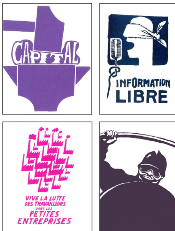
Figura 2 – Exemplos de cartazes do Atelier Populaire , 1968. (McQUINSTON, 1993)

Visualmente, explorava uma alternativa aos resultados sofisticados dos cartazes publicitários que a população estava acostumada, o que chamava ainda mais atenção. Seu intuito era causar surpresa e estimular a ação. Utilizando muitas vezes apenas uma cor chapada, com letras escritas à mão e desenhos de silhuetas para a produção serigráfica, o layout era muitas vezes preparado rapidamente, sendo que um acontecimento obscurecido pela mídia oficial num dia era amplamente divulgado no outro, através da distribuição feita por estudantes e trabalhadores por toda a França (Figura 2).