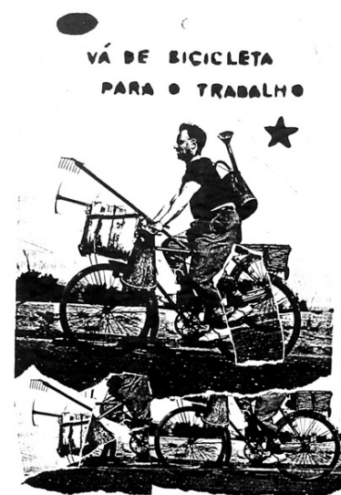
Figura 3 – Vá de bicicleta ao trabalho, 2006.

Espalhados pelos centros urbanos, cartazes como o da Figura 3, representam um tipo de intervenção que podem ser consideradas unicamente como manifestações artísticas, mas apenas se considerarmos de uma forma bem estreita as finalidades do design gráfico. A imagem mostra um homem andando de bicicleta carregando ferramentas de jardinagem. No texto, escrito logo acima, lê-se vá de bicicleta ao trabalho . No contexto urbano, supõe-se que esta seja uma alternativa ao uso de veículos automotivos que é reconhecidamente um dos principais poluentes da atmosfera. Em contraste, embora a representação seja em preto e branco, o ambiente do ciclista sugere um clima idílico, reforçado pela atividade de jardinagem mas também pela paisagem sem prédios em que ele está e uma estrela desenhada no canto direito. O tema do cartaz é o cotidiano, que pode ser mudado. A forma como nos locomovemos, a atividade profissional, o entorno em que vivemos.