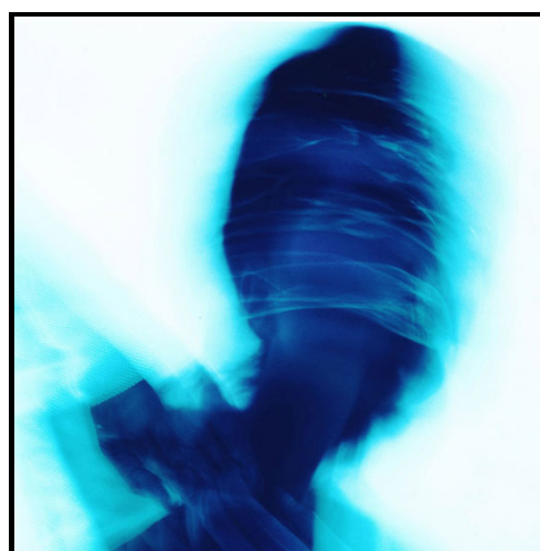
Figura 6: Foto Klaus

Ambas as fotos são abstratas e utilizam-se de efeitos de desfoque da imagem. Precisamos considerar que Man Ray utilizou recursos artesanais para obter o efeito desejado nas fotos. Não sabemos se o objeto era translúcido, não deixando toda a luz passar para queimar o papel fotosensível, ou se Man Ray movimentou o objeto enquanto o papel era exposto a luz. Klaus, por sua vez, utilizou recursos tecnológicos que possibilitaram o mesmo efeito.