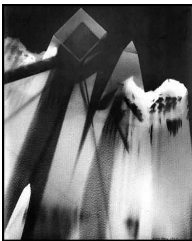
Figura 1: Fotograma

Man Ray utilizava várias técnicas para criar efeitos em seus trabalhos fotográficos, destacando-se entre elas a técnica dos fotogramas e a solarização.