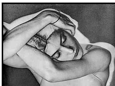
Figura 2: Fotografia solarizada

[...] processo também conhecido como efeito Sabattier, em referência ao seu inventor, o francês Armand Sabattier (1834-1910) que o concebeu em 1862. A solarização consiste na inversão dos valores tonais de algumas áreas da imagem fotográfica, que pode ser obtido basicamente através da rápida exposição à luz da imagem durante seu processamento. Foi o norte-americano radicado em Paris Man Ray (1890-1976) quem melhor empregou a solarização com finalidades artísticas durante a década de 1930 [...] ( www.itaucultural.org.br )