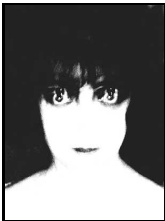
Figura 7: Fotografia Man Ray