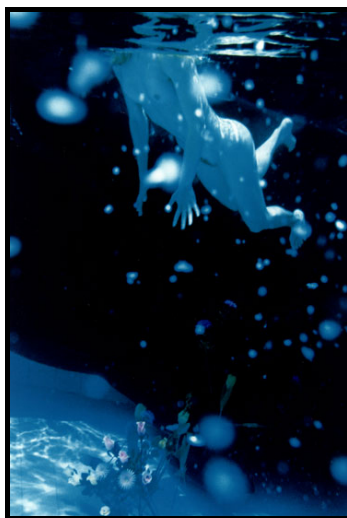
Figura 3: Ophelias Death

registrar imagens documentais, captar a realidade, mas sim, uma fotografia com intenções artísticas.