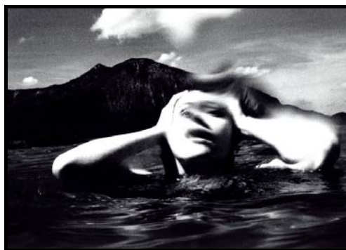
Figura 8: Foto Klaus 02

Além de as duas fotos explorarem o rosto, elas novamente exploram o efeito de desfoque, para aumentar a idéia de movimento. Não há registros de como Man Ray realizou este efeito (provavelmente movimentando a câmera enquanto tirava a fotografia), mas sabemos que Klaus utilizou softwares gráficos para manipular sua fotografia.