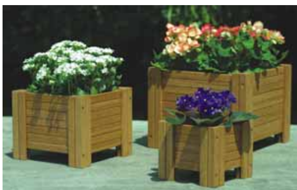
Figura 6: Caixa de flores.

Após as análises, verificou-se que, para os modelos tradicionais de móveis fabricados, realmente as peças de descartes não poderiam ser utilizadas, todavia, para novos produtos de tamanho menor, sim. Para isso foram desenvolvidas novas linhas de produtos, sem deixar de lado a certificação e usando o maquinário existente. As novas peças projetadas foram: uma linha de caixa de flores e uma linha de tábua de churrasco, ambas com diferenciais em relação aos produtos semelhantes no mercado e saindo dos móveis tradicionais produzidos pela empresa (figura 6 e 7).