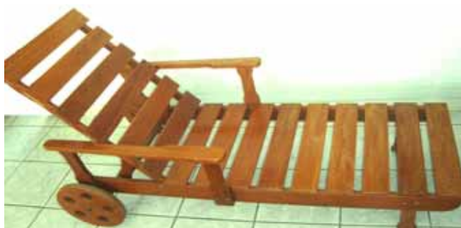
Figura 4: Espreguiçadeira Garopaba.

Já existe uma infinidade de modelos de espreguiçadeiras no mercado, inclusive na empresa onde foi desenvolvido o projeto. Os antigos desenhos em madeira, entretanto, como a “Espreguiçadeira Garopaba” (figura 4), tinham o aspecto visual pesado, consumiam muita matéria-prima devido às ripas de madeira largas (6,5cm), o design estava bastante desatualizado comprometendo o uso interno destas peças, tinham pouca versatilidade e não aproveitavam nenhum retalho.