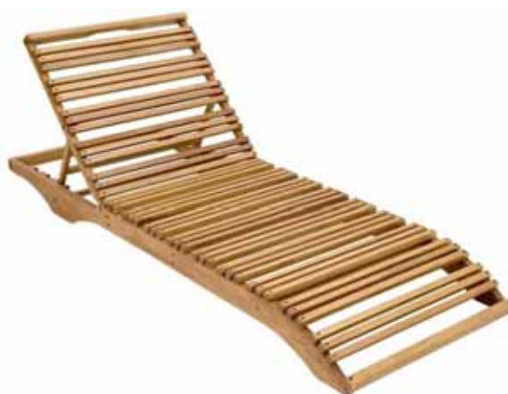
Figura 5: Chaise Ibiza.

O aspecto ambiental da concepção do produto (ecodesign) vem do aproveitamento de retalhos e sobras de madeira, provenientes da própria indústria, que já fabrica outros móveis deste material. O novo modelo aproveita retalhos para a confecção do regulador do encosto (0,0010 m 3 ), trava do encosto (0,0006 m 3 ) e lateral da trava do encosto.