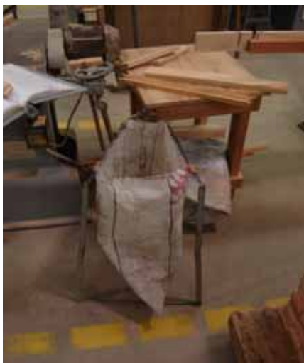
Figura 3: Sacos de ráfia recebendo resíduos.

As lixas chegaram a ser descartadas numa média de 2,48 toneladas por mês no ano de 2005. A partir de 2006 passaram a ser revendidas para outras empresas que usam as lixas gastas. Antes a destinação final era o aterro, assim como as estopas, que passaram a ser utilizadas também para a produção de energia. O único resíduo que ainda não pode ser vendido, reciclado ou reaproveitado são os recipientes de óleo e tintas que são levados para o Aterro Industrial de Blumenau.