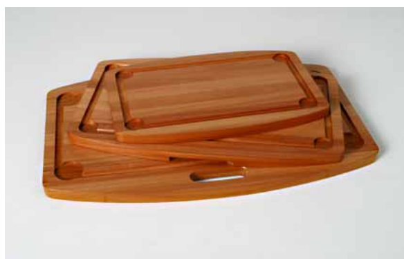
Figura 7: Tábua de carne