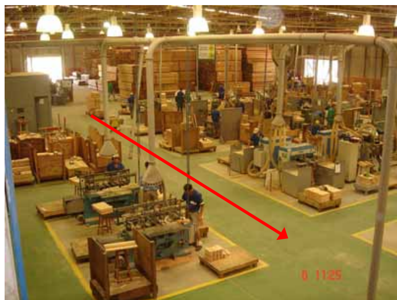
Figura 2: novo parque fabril.

A partir da construção do novo parque fabril esses problemas foram solucionados. Foram criados caminhos para escoamento de produtos e circulação dos trabalhadores, as peças dentro do processo de produção seguem uma linearidade. Todas as máquinas que geram resíduos como pequenos pedaços de madeira e serragem passaram a ser providos de sistemas de sucção/exaustão que levam para um silo os resíduos sugados, conforme a figura 2.