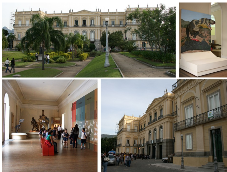
Figura 1. Museu Nacional da Quinta da Boa Vista (MNRJ). Acima (esquerda) e abaixo (direita) vista geral do prédio; acima (direita) e abaixo (esquerda) salas de exposição de paleontologia. Fotos tiradas durante o evento de comemoração do aniversário de 190 anos da instituição (27 de junho de 2008).

Criado por D. João VI, em 06 de junho de 1818, trata-se da mais antiga instituição científica do Brasil e o maior museu de história natural e antropológica da América Latina. Desde 1892 o MNRJ está situado na antiga residência da família imperial brasileira, conferindo a ele um caráter especial frente a outras instituições do mesmo gênero e uma importância grande à própria arquitetura da construção e não apenas ao seu acervo (Figura 1). O salão de entrada da exposição do MNRJ e uma sala contígua com dinossauros e outros répteis fósseis correspondem às salas de paleontologia, sendo parte do material ali exposto do acervo do Setor de Paleovertebrados.