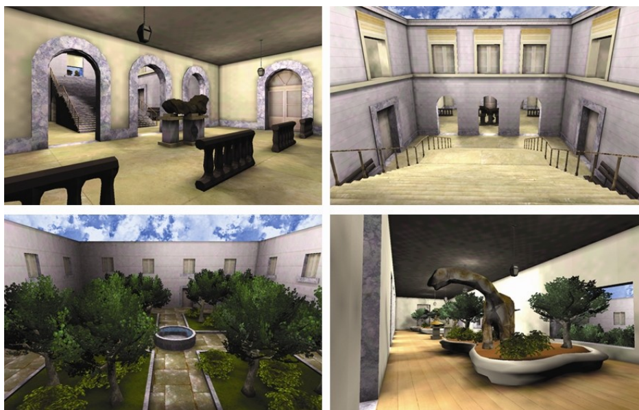
Figura 5. Imagens capturadas do MNRJ Virtual: Salão de entrada e escadaria (no alto); jardim interno e sala de exposição. (em baixo).

Propositalmente, a disposição e a dimensão real das salas de exposição do MNRJ foram alteradas no ambiente virtual, para comportar o novo acervo digital. Procurou-se assim, utilizar o potencial e as características do mundo virtual, capaz de definir a quantidade de salas, bem como o seu tamanho e a sua disposição de acordo com as características das peças a serem expostas, impossível de se realizar no mundo real. Mesmo assim, é possível reconhecer o MNRJ real no cenário virtual através das representações semelhantes de paredes, portas, pisos e de alguns ambientes conhecidos dele (Figura 5). Com isso foi possível destacar a importância da arquitetura do ambiente representado e obter as vantagens de se adaptar o cenário virtual às necessidades do aplicativo desenvolvido.