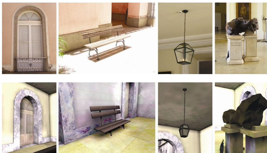
Figura 2. Fotos do MNRJ usadas como base para a criação de um cenário virtual semelhante ao museu real (acima) e imagens do Museu Virtual criado a partir das fotografias (abaixo).

O MNRJ possui arquitetura especialmente importante devido ao seu valor histórico. Embora o ambiente virtual possibilite apresentar exposições de formas impossíveis em um ambiente real de um museu (LEPOURAS et al. , 2004), optou-se por utilizar a área de exposição do MNRJ como base para a construção da exposição virtual, já que o próprio MNRJ é um grande atrativo por si só. Logo, respeitar a arquitetura real do museu em seus aspectos visuais foi considerado importante para agregar valor à exposição virtual. A ferramenta utilizada se mostra eficaz na reconstrução fiel de cenários reais, tanto internos como externos, como demonstrado por DELEON & BERRY (2000) nos projetos da Catedral de Notre Dame e do Parque Nacional de Everglades, na Flórida. Considerando isso, foram utilizadas as plantas do museu e fotografias para criar um ambiente virtual que fizesse com que o usuário reconhecesse nele o MNRJ real (Figura 2).