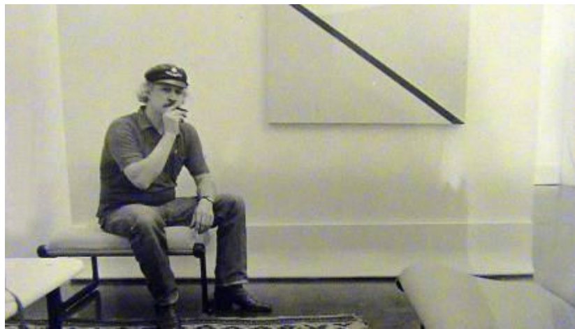
Figura 01: Wesley Duke Lee na década de 70 na Galeria Luisa Strina.

Wesley Duke Lee tornou-se importante agitador cultural, quebrou barreiras, explorou o erotismo, debateu o poder e o mercado e foi grande colaborador dos meios de comunicação. Apresentou seu trabalho não só nas galerias, nos museus e em exposições, mas também publicou seu trabalho em jornais, revistas e catálogos, sendo evidente sua pluralidade como artista multifacetado e um profícuo explorador da imagem.