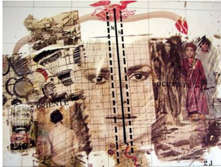
Figura 02: Obra da série Cartografias Anímicas. Técnica Mista e Off Set sobre papel cartográfico. Wesley Duke Lee; 1980.

Ainda que as imagens sejam coletivas, apropriadas de jornais e revistas, sua composição no interior do sujeito é única, resultando em mapas afetivos da alma. Isso pode ser exemplificado quando ele compõe uma imagem dos Estados Unidos ao lado do Vietnã, por exemplo, e tenta pontilhar o rascunho de uma estrada ligando os dois locais geográficos ligados apenas pelo seu olhar, apresentando relações que extrapolam interpretações físicas que os mapas propõem. Além disso, Wesley inclui também fotos pessoais, de família, criando todo contexto que se refere, ao mesmo tempo, a seu universo pessoal e à coletividade.