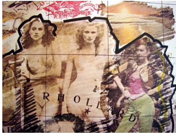
Cartografia Anímica, 1980.

O erotismo é outro elemento bastante presente em toda sua obra, mas como manifestação da vida e da própria criação.