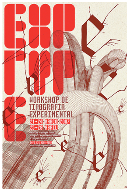
Figura 6. Hugo Werner. EXP TYPE - Workshop de tipografia experimental , 2007.

Um cartaz desta pequena coleção foi selecionado para registro mais aprofundado: EXP TYPE - Workshop de tipografia experimental , de autoria de Hugo Werner, da Hugo Werner Design (figura 6). Trata-se de uma peça de divulgação de dois workshops realizados sobre o tema “tipografia experimental”. O designer foi contatado, tendo em vista a obtenção de informações relacionadas ao processo criativo. Werner (comunicação pessoal, 2008) descreveu o processo de concepção da peça e acrescentou referências bibliográficas sobre conceitos trabalhados: