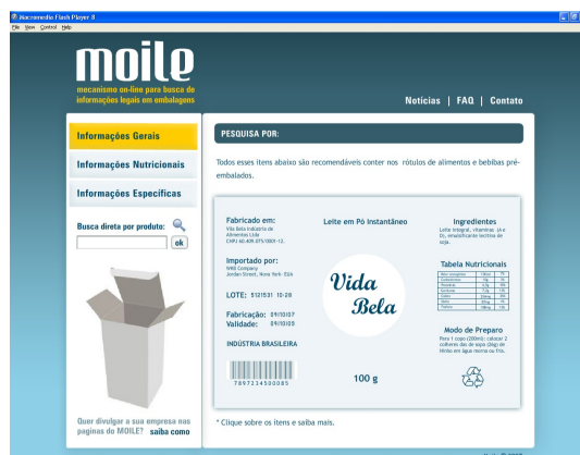
Figura 03 – Requisição de informações gerais no menu.

Moile: ferramenta de auxílio na busca de elementos textuais para embalagens de bebidas e alimentos pré-medidos