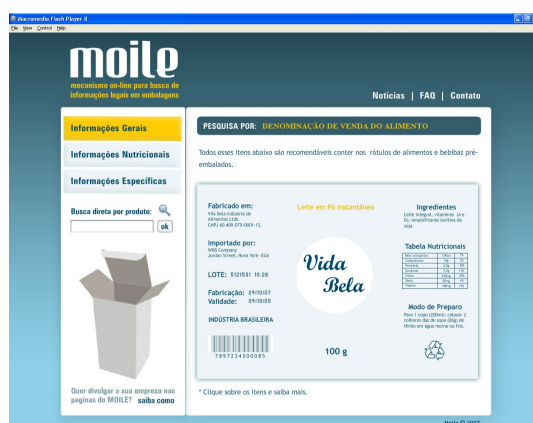
Figura 04 – Requisição de informações gerais por meio do rótulo modelo.