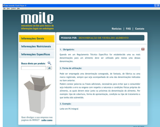
Figura 05 – Obtenção do conteúdo das normativas, sobre o elemento requerido.

Essa configuração elimina algumas limitações existentes no processo atual de busca e o reduz de quatro para duas etapas: 1) localizar as informações na ferramenta e; 2) compreender as informações ali dispostas. A primeira etapa do processo foi eliminada pela própria concentração na ferramenta, das informações de ambos os órgãos de controle; assim como a terceira, uma vez que a ferramenta proposta tem sistematizados apenas os dados relativos a