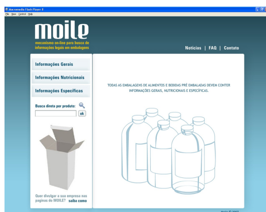
Figura 02 – Tela inicial da ferramenta.

Na seqüência é demonstrada uma simulação de uso para a obtenção de informações gerais. Inclui a tela inicial da ferramenta (Figura 02); a utilização do menu esquerdo para requisitar informações gerais e o conseqüente aparecimento do rótulo modelo no lado direito da tela (Figura 03); a utilização do rótulo modelo para identificar a terminologia oficial utilizada em cada um dos elementos que o compõem (Figura 04); e o resultado do clique sobre o elemento e a obtenção do conteúdo das normativas (Figura 05).